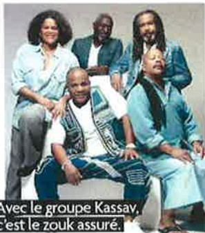
Avec le groupe Kassav, c'est le zouk assuré.

J.B. : Tout à fait. Notamment les enfants antillais qui ont migré en métropole dans les années 50. Ils avaient perdu une part de leurs racines et se sont identifiés à notre musique. Encore aujourd'hui, il y a beaucoup de gens qui nous